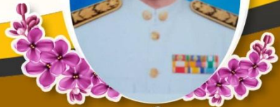
นายดำรงศักดิ์ หงษ์ทะนี ผู้อำนวยการศูนย์วิจัยและพัฒนาอาหารสัตว์อีสาน

ฉบับที่ 13 ปีที่ 4 ประจำวันที่ 3 เมษายน 2567